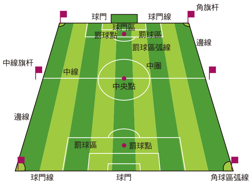
圖一：足球場界線及設備

12 碼罰球（Penalty kick）又被稱為足球的極刑，是防守方於自己的禁區內犯規時所採用的懲罰。罰球時，球會放置於罰球點 1 上，此時，除了罰球者以及守門員以外，其他所有球員皆必須在 18 碼禁區外圍並與罰球者保持 10 碼以上的距離。對於在罰球者接觸到球之前只能站在球門線上的守門員而言，大腦得花費 0.1 秒的時間處理從眼睛接收到的訊息，之後再花 0.1 秒的時間決定撲球方向，平均而言，守門員撲到球門角落所需花費的時間長達 0.73 秒。但罰球者踢出的球，平均只需 0.4 秒就能抵達球門角落。故 12 碼罰球的判罰與否往往會左右雙方的勝負，除非球員明顯犯規，一般裁判在正規賽中會盡量避免判罰 12 碼罰球。